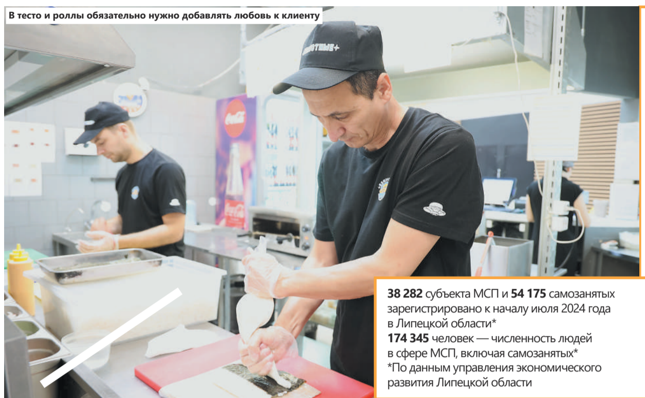
В тесто и роллы обязательно нужно добавлять любовь к клиенту

38 282 субъекта МСП и 54 175 самозанятых зарегистрировано к началу июля 2024 года в Липецкой области* 174 345 человек — численность людей в сфере МСП, включая самозанятых* *По данным управления экономического развития Липецкой области