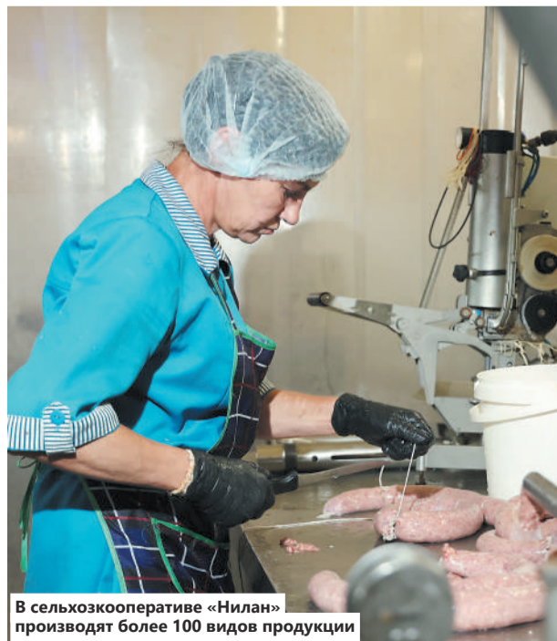
В сельхозкооперативе «Нилан» производят более 100 видов продукции