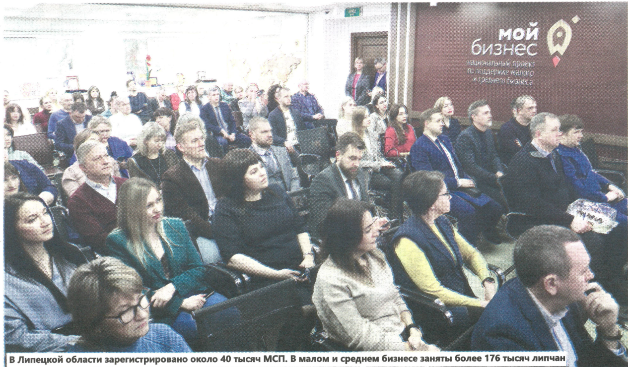
В Липецкой области зарегистрировано около 40 тысяч МСП. В малом и среднем бизнесе заняты более 176 тысяч липчан

Только в прошлом году экспортные контракты заключили 40 липецких компаний. Объём экспорта достиг больше 16 млн долларов.